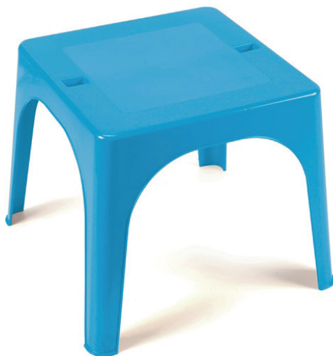
TABLE ENFANT N° 1610 - Réf : 10000178120