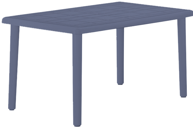
TABLE OLOT N° 1610 - Réf : 10000177842